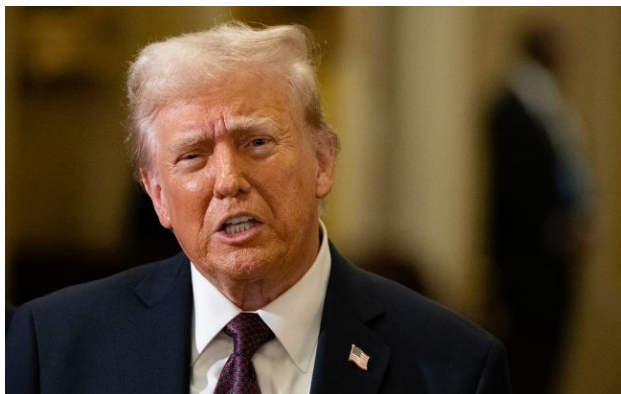
Фото: Дональд Трамп, президент США (Getty Images)

Президент США Дональд Трамп розповів про результати своєї розмови із російським диктатором Володимиром Путіним. За його словами, РФ "ще давно" була готова до мирної угоди.