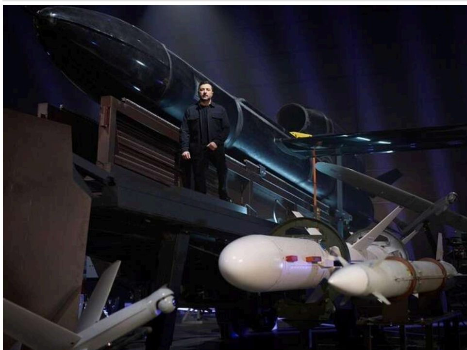
«Майбутнє вже на полі бою»: Зеленський заявив про створення нової оборонної індустрії України

Президент Володимир Зеленський 13 квітня привітав працівників оборонно-промислового комплексу України з професійним святом і заявив, що за останні роки країна фактично створила нову оборонну індустрію.