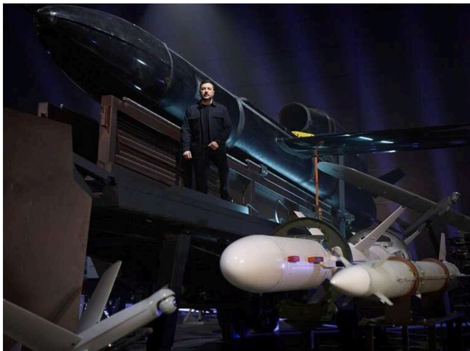
«Майбутнє вже на полі бою»: Зеленський заявив про створення нової оборонної індустрії України

Президент Володимир Зеленський 13 квітня привітав працівників оборонно-промислового комплексу України з професійним святом і заявив, що за останні роки країна фактично створила нову оборонну індустрію.