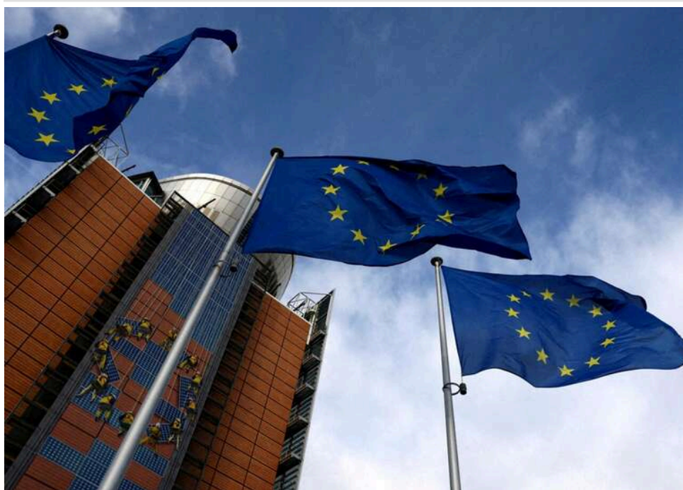
35 мільярдів євро в обмін на 27 реформ: ЄС висунув Петеру Мадяру жорсткий ультиматум

Європейський Союз висунув 27 вимог новому прем'єр-міністру Угорщини в обмін на розмороження для країни €35 млрд європейських субсидій.