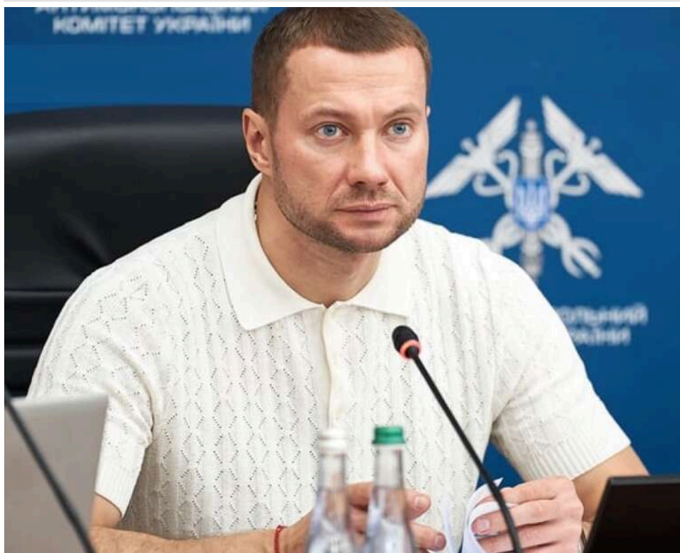
Справа голови АМКУ Павла Кириленка може піти на друге коло через оновлення складу ВАКС

Троє суддів першої інстанції Вищого антикорсуду переходять на роботу до Апеляції ВАКС. Тож замість них призначають нових суддів, що стане підставою для розгляду деяких справ спочатку.