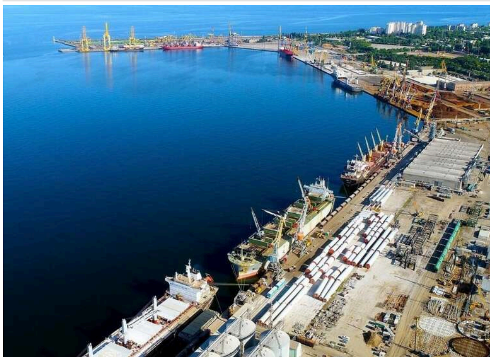
«Державна стратегія в конвертах»: як чиновники готують портову концесію на 40 років за зачиненими дверима

Чиновники облетіли пів світу за кошти платників податків, презентуючи «проект століття», але в підсумку все обговорення в парламенті звелось до кольору паперу та процедури відкриття секретних пакетів.