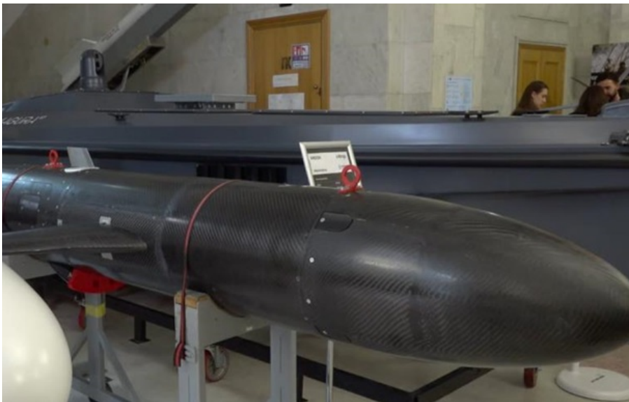
Ракета-дрон Areion

Areion постачається у контейнері для запуску з установки комплексу "Нептун", однак її також можна перевозити та запускати з причепа або напівпричепа - аналогічно до "Паляниці".