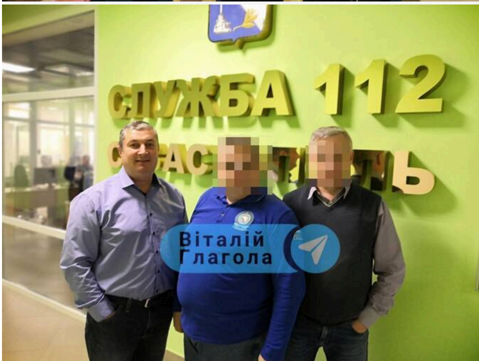
Клименко: переговори зі стрілкою тривали 40 хвилин