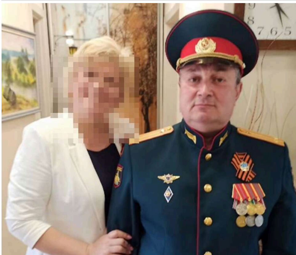
Підполковник армії РФ з українським паспортом: розкриті шокуючі подробиці про особу «голосковського стрільця»

У стрільця була легально зареєстрована зброя, — міністр внутрішніх справ Клименко.