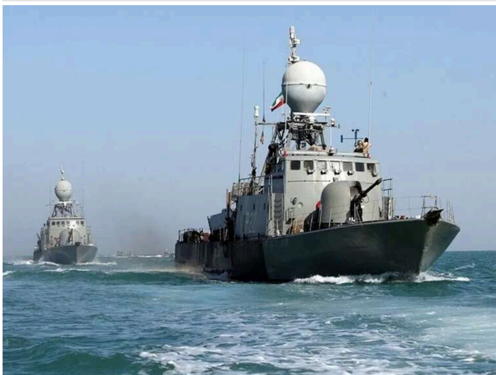
США задіяли понад 15 військових кораблів для операції в районі Ормузької протоки, – WSJ