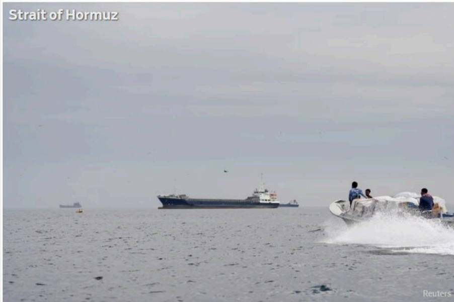
Strait of Hormuz

Теги: Ормузский пролив, блокада, Иран, Иран, США