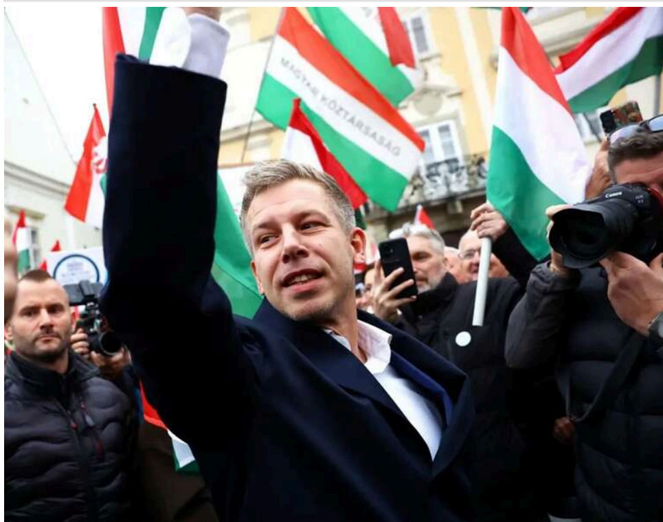
«Я візьму трубку»: Петер Мадяр розповів, що сказав би Путіну про війну в Україні у разі дзвінка

Лідер угорської партії "Тиса" Петер Мадяр заявив, що відповідь на телефонний дзвінок російського диктатора Володимира Путіна, але не дзвонитиме йому сам.