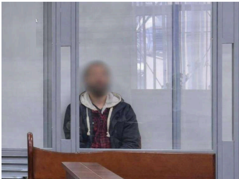
Довічне ув'язнення за роки насилля: на Київщині винесли вирок вітчиму, який ґвалтував падчерку з 10 років

Вітчима, який роками ґвалтував падчерку, засудили до довічного позбавлення волі.