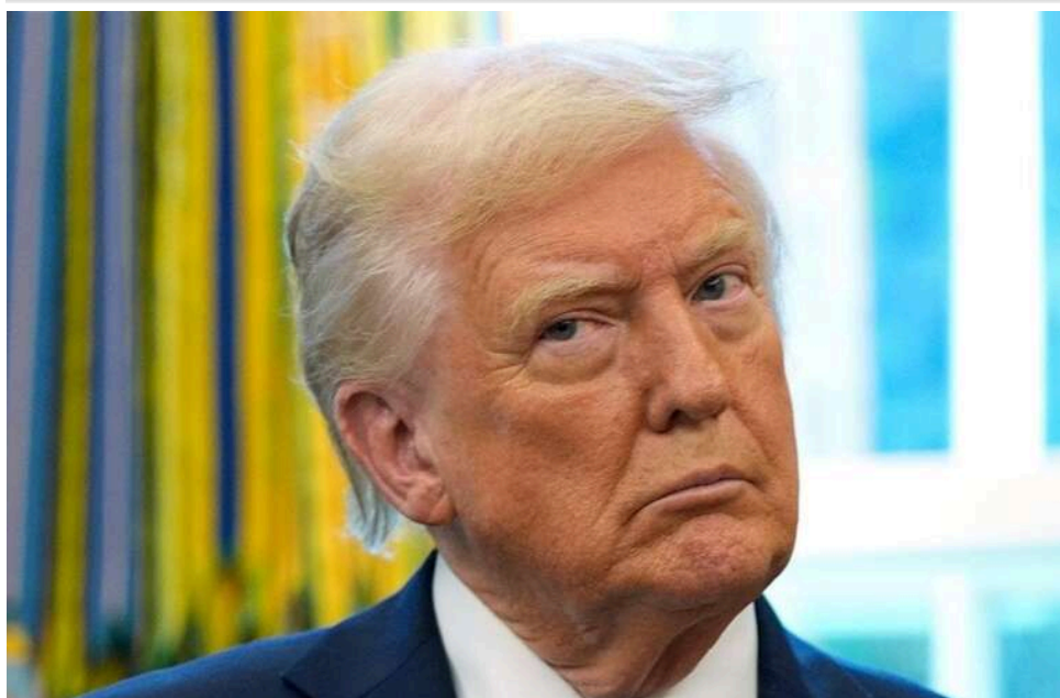
Axios: Трамп підтримує продовження блокади Ірану як інструмент тиску на Тегеран

Трамп заявив про намір зберігати морську блокаду Ірану, доки Тегеран повністю не відмовиться від ядерної програми.