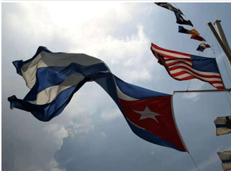
Таємна дипломатія в Гавані: США та Куба провели перші за 10 років секретні переговори про зняття ембарго

США вперше за десять років організували таємні переговори з Кубою в Гавані – на порядку денному стояли реформи та питання скасування ембарго.