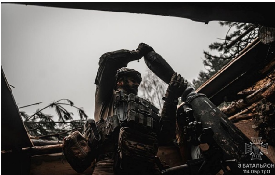
Фото: 114 Обр ТрО ЗСУ ведуть важкі бої в прикордонні

Командування пішло на такі кроки внаслідок інтенсивних бойових дій і переваги противника в силах та засобах.