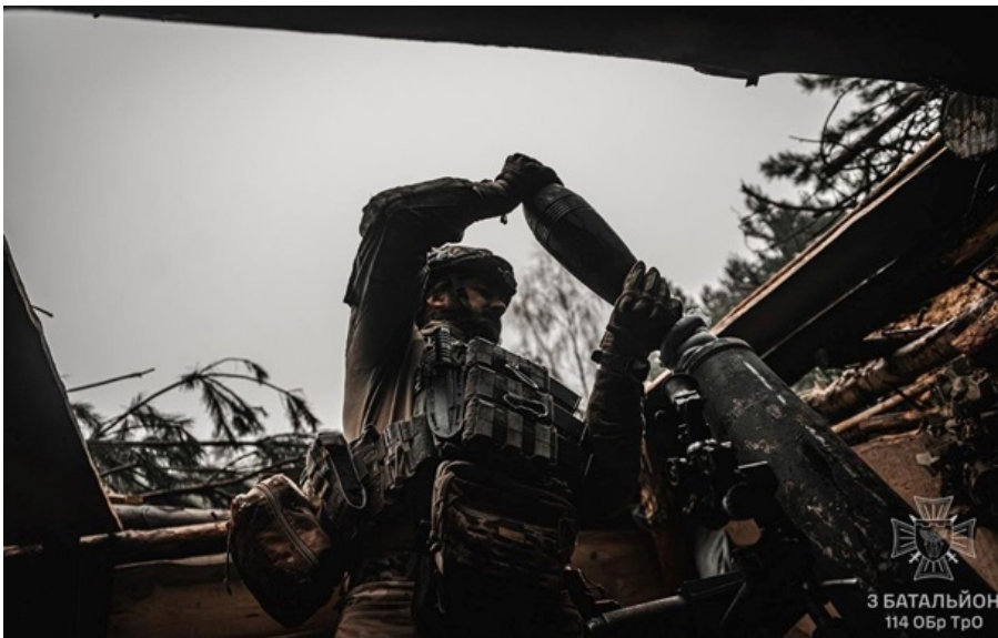
Фото: 114 Обр ТрО ЗСУ ведуть важкі бої в прикордонні

Командування пішло на такі кроки внаслідок інтенсивних бойових дій і переваги противника в силах та засобах.