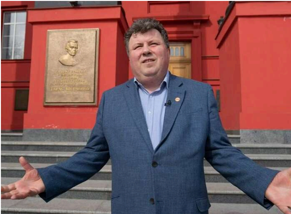
Від інтимних переписок до розкрадання коштів: студенти КНУ імені Шевченка вимагають негайної відставки Бугрова

Студенти КНУ ім. Шевченка вимагають від Міносвіти відсторонити ректора Бугрова через його оргії в аудиторіях.