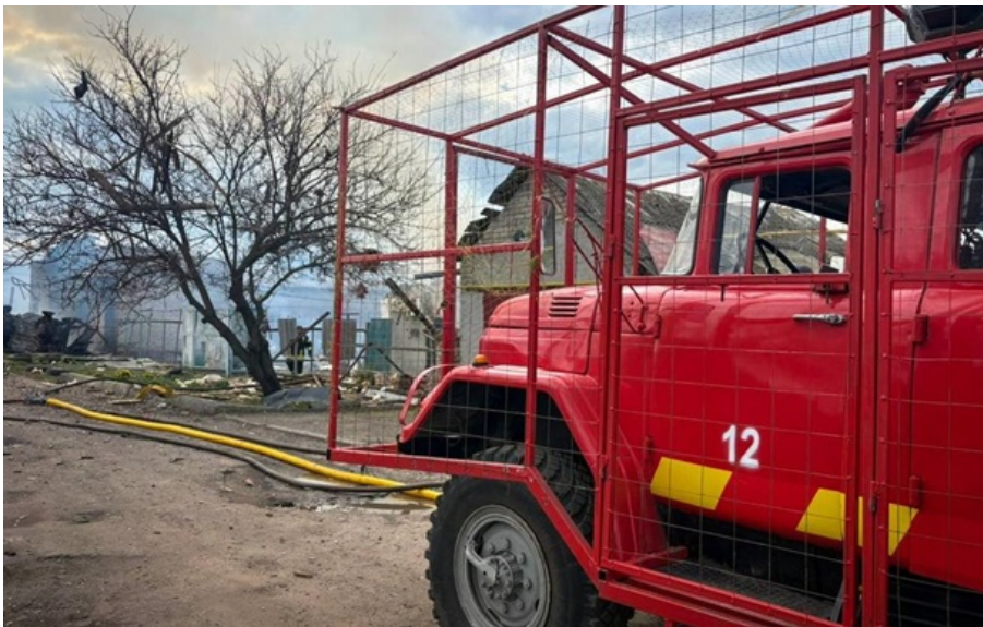
Росіяни вдарили дроном по селищу Великий Бурлук

У селищі Великий Бурлук пошкоджені чотири приватні будинки. Загорівся будинок та автомобіль.