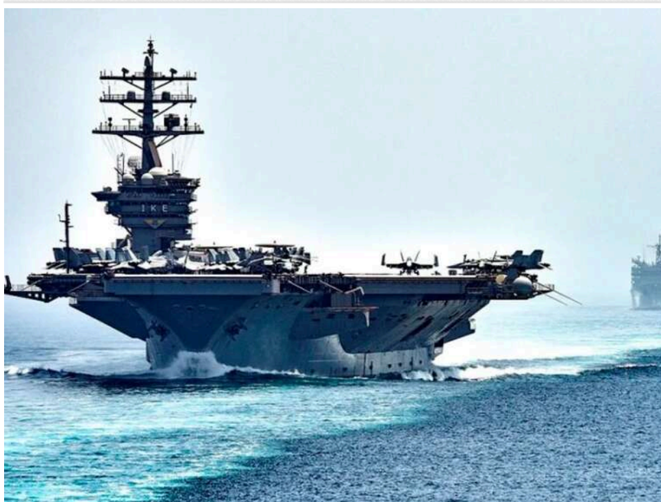
США офіційно ввели морську блокаду Ірану: Центком оголосив правила проходу через Ормузьку протоку