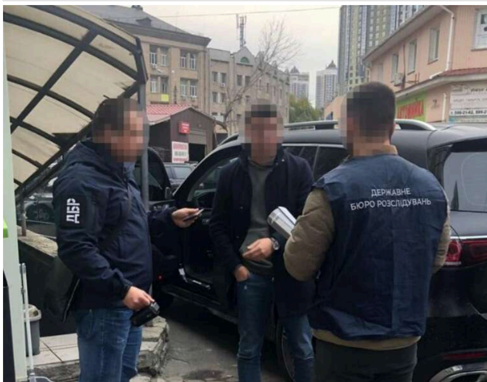
ДБР викрило київську організовану групу, яка намагалася привласнити елітні квартири через підроблені документи

Працівники ДБР завершили розслідування кримінального провадження щодо організованої групи з Києва, яка намагалася заволодіти елітними квартирами громадян. Обвинувальний акт щодо учасників групи скеровано до суду.