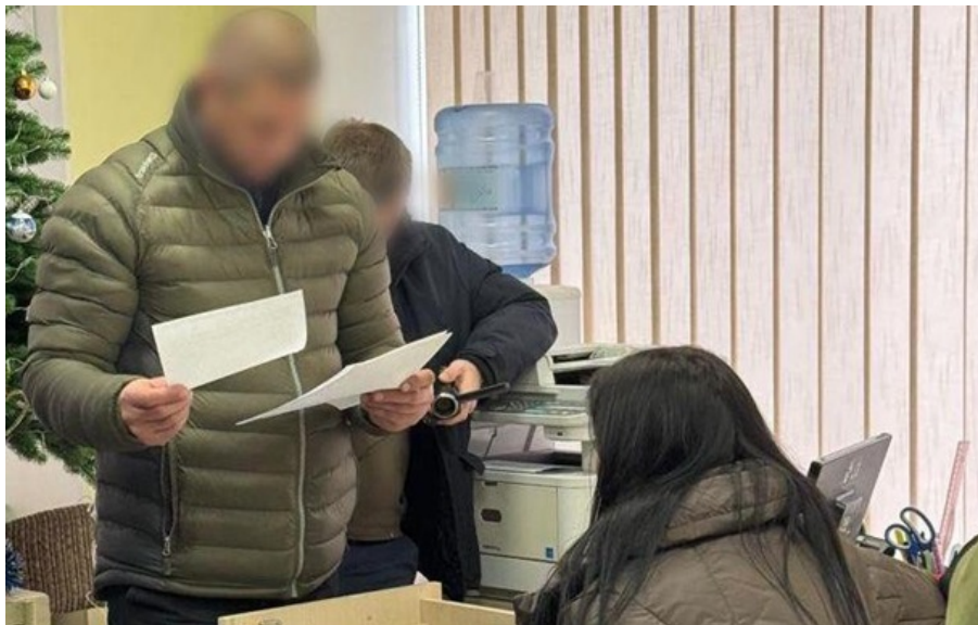
Жінці повідомили про підозру

Жінка заволоділа коштами бабусі шляхом систематичного зняття готівки з її рахунку у банкоматах.