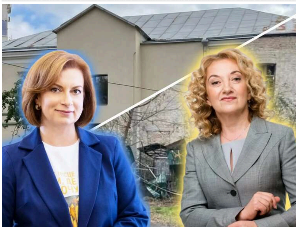
Реставрація за 75 мільйонів: кошторис відновлення «будинку бургомістра» на Подолі зріс у 4,5 раза

У столиці з другої спроби майже за 75 млн гривень стартує реставрація історичної будівлі на вулиці Сквороди, 9-Б. Будинок, що колись належав київському бургомістру (очільнику міста) і пережив Подільську пожежу 1811 року, почали оновлювати ще шість років тому. Однак через брак коштів, нововиявлені пошкодження та численні скандали – роботи зупинили. З того часу будинок прийшов у жалюгідний стан, а кошторисна вартість його відновлення зростає у 4,5 раза. Згідно з новим договором підряду, завершити реставрацію планують до кінця 2028 року.