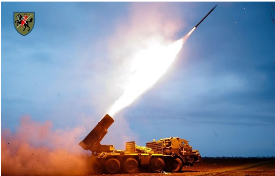
Фото: 110 ОМБр ЗСУ ведуть важкі бої на сході і півдні України

Найбільше зусиль росіяни традиційно концентрують на Покровському і Костянтинівському напрямках.