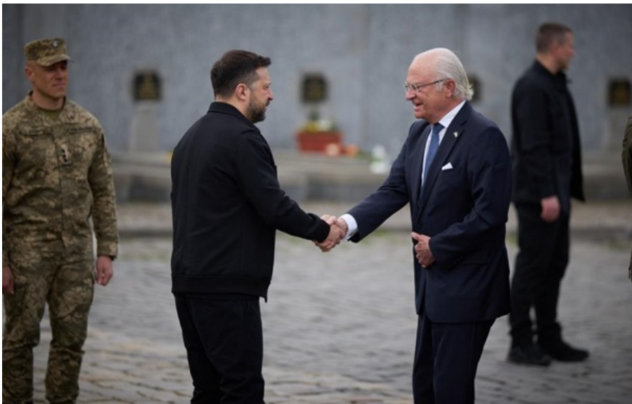
Володимир Зеленський і Карл XVI Густав зустрілися у Львові

Допомога передбачає не лише мільярдне фінансування, а й розвиток військової співпраці, зокрема в авіаційній сфері.