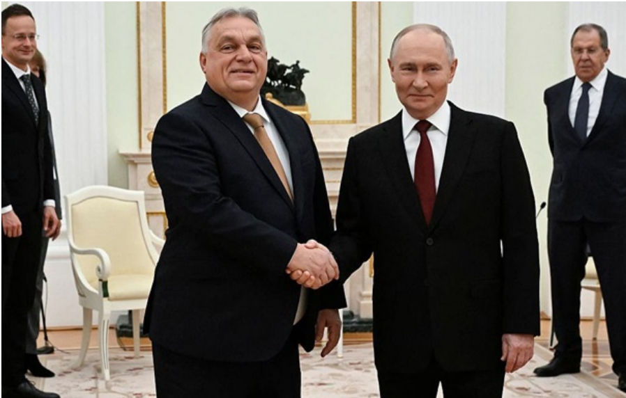
Володимир Путін "дружив" з Віктором Орбаном багато років

Дмитро Песков відповів на питання, чи дружила Росія виключно з діючим прем'єром Угорщини Віктором Орбаном.