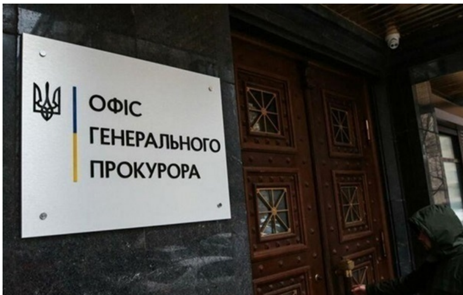
Фото: Радіо Свобода (ілюстративне фото) В Офісі генпрокурора повідомили подробиці справи

З серпня 2022 року чоловік гвалтував не лише свою падчерку, а й її подругу, якій на момент вчинення злочину виповнилось 15 років.