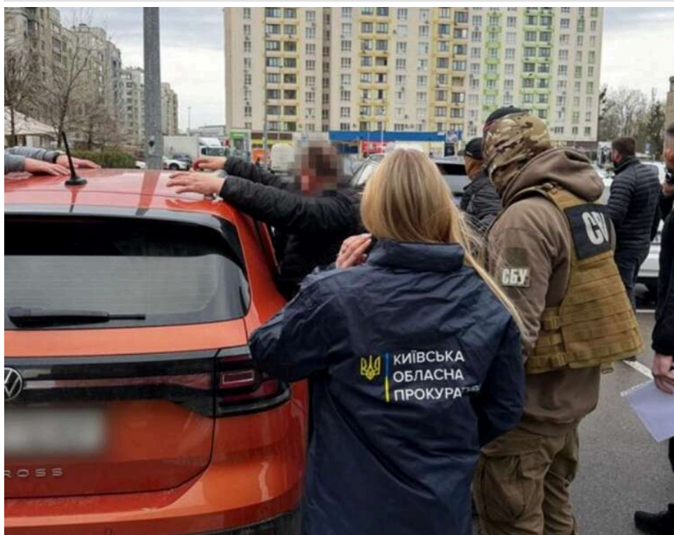
Діагноз за 20 тисяч доларів: на Київщині викрито подружжя, яке торгувало фіктивними медичними довідками

За процесуального керівництва Київської обласної прокуратури викрито подружжя, яке організувало схему одержання неправомірної вигоди за вплив на рішення службових осіб медичних закладів (ч. 2 ст. 28, ч. 3 ст. 369-2 КК України).