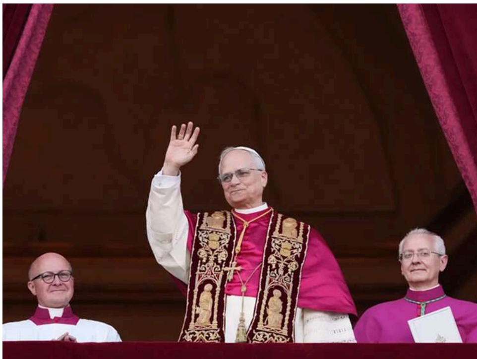
«Я не боюся адміністрації Трампа»: Папа Лев XIV відповів на критику президента США та закликав будувати мости

Папа Римський Лев XIV заявив, що не боїться критики президента США Дональда Трампа і продовжить передавати ті послання, які вважає за необхідне.