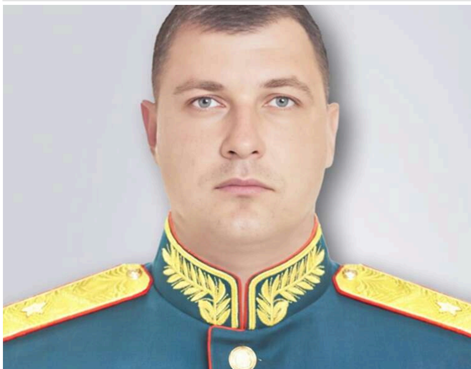
СБУ оголосила підозру російському генералу Барілу: Наказав ув'язнити 369 людей у підвалі школи в Ягідному

Служба безпеки України заочно оголосила про підозру генерал-майору ЗС РФ Денису Барілу, який у березні 2022 року керував частинами російської армії під час окупації Ягідного на Чернігівщині.