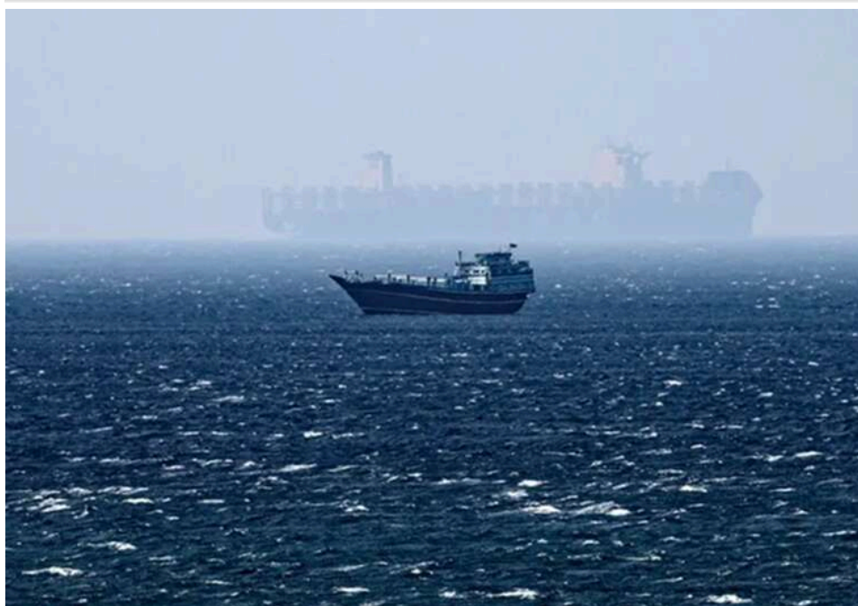
«Жоден порт не буде в безпеці»: Іран назвав дії США піратством та готує блокаду Перської затоки

Іран охарактеризував дії США як «піратство» та попередив про можливі відповідні кроки в Перській затоці.