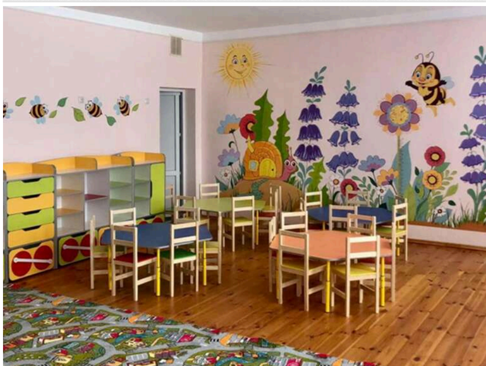
Освітня криза Харкова: колись переповнений дитсадок може припинити роботу через недобір дітей

У Харкові дитячі садки, раніше переповнені дітьми, тепер ризикують закритися через нестачу дітей.