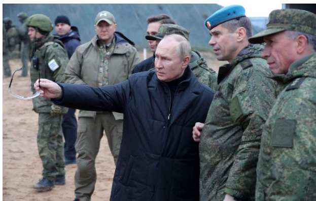
Фото: Володимир Путін

Російська армія неспроможна виконати завдання Кремля, але Москва планує розширення мобілізації та опрацьовує операції проти НАТО. Тим часом Білорусь закрила "лазівку" для втечі росіян-ухлянтів.