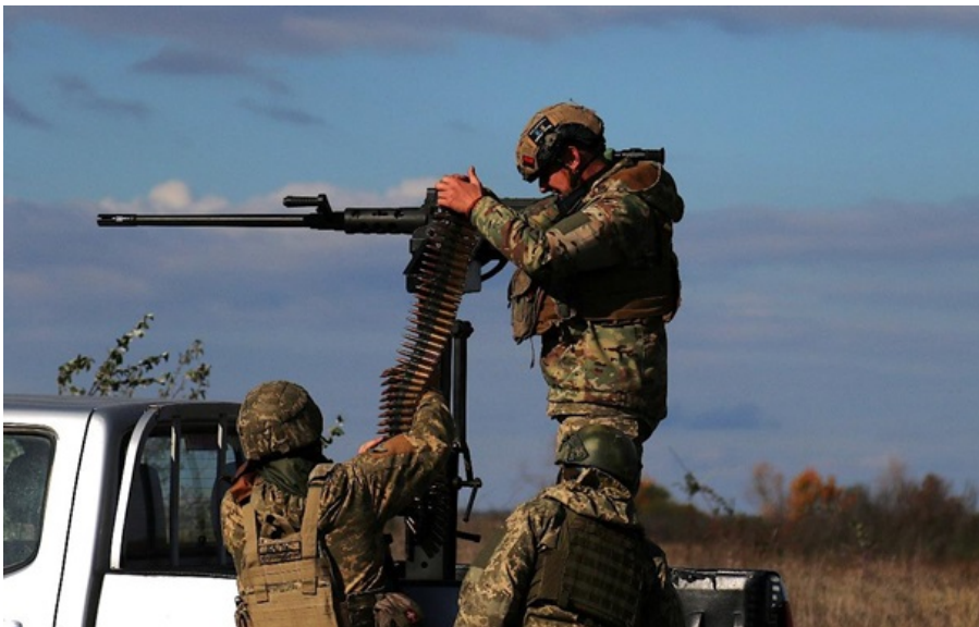
Фото: Генштаб ЗСУ / Facebook (ілюстративне фото)

Мобільна вогнева група працювала по одному шахеду, а другий у цей момент полював на екіпаж