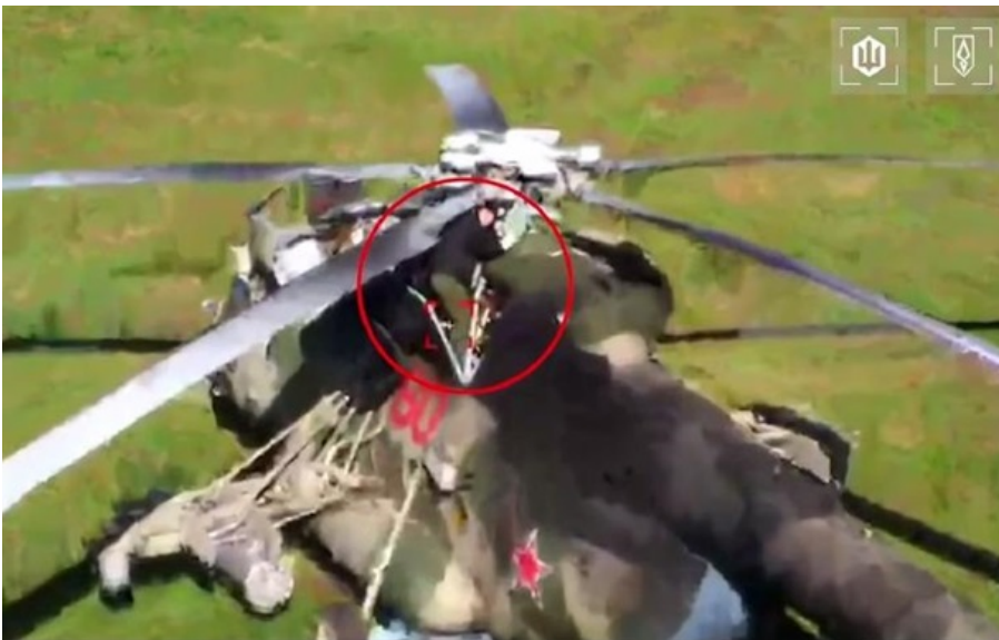
Знищено мінімум одного з спеціалістів обслуговування гвинтокрилів

Атаки зазнав польовий злітно-посадковий майданчик ворога у глибині понад 150 км від лінії бойового зіткнення.