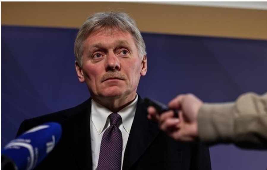
Дмитро Песков сподівається на "прагматичні" стосунки з Угорщиною