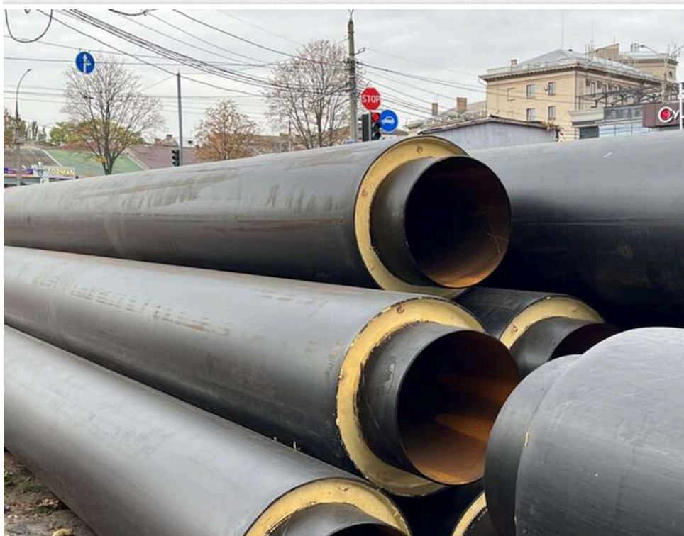
Труби на 14,6 мільйона гривень: «Терполімергаз» став постачальником для Новобузького водоканалу після відмови конкурентів

КП «Водопровідні мережі» Новобузької міської ради (Миколаївська обл) 8 квітня за результатами тендеру уклало угоду з ТОВ «Полімерна група «Терполімергаз» на постачання поліетиленових водопровідних труб на 14,65 млн грн.