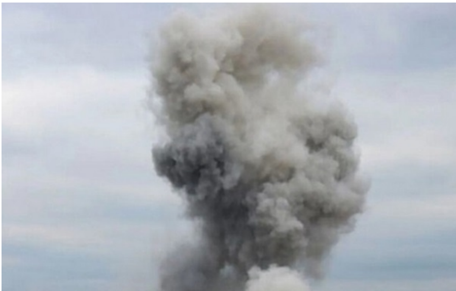
Фото: Соцмережі (ілюстративне фото) Окупанти вдарили по Дергачах

Внаслідок ворожого удару поранень зазнали п'ятеро цивільних осіб, двоє з них перебувають у важкому стані.