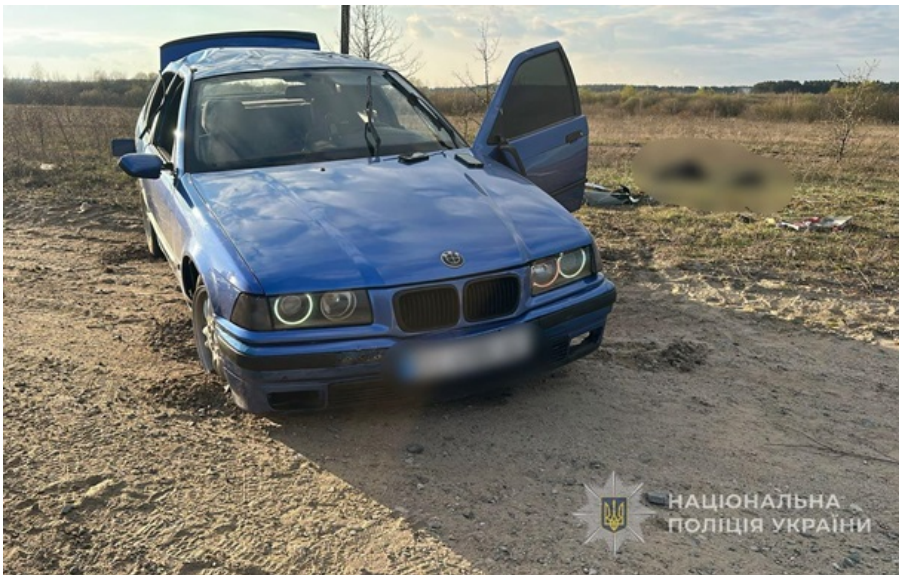
Аварія сталася між селами Хоцунь та Сваловичі

17-річний водій BMW не впорався з керуванням і з'їхав на узбіччя дороги. Авто кілька разів перевернулось.