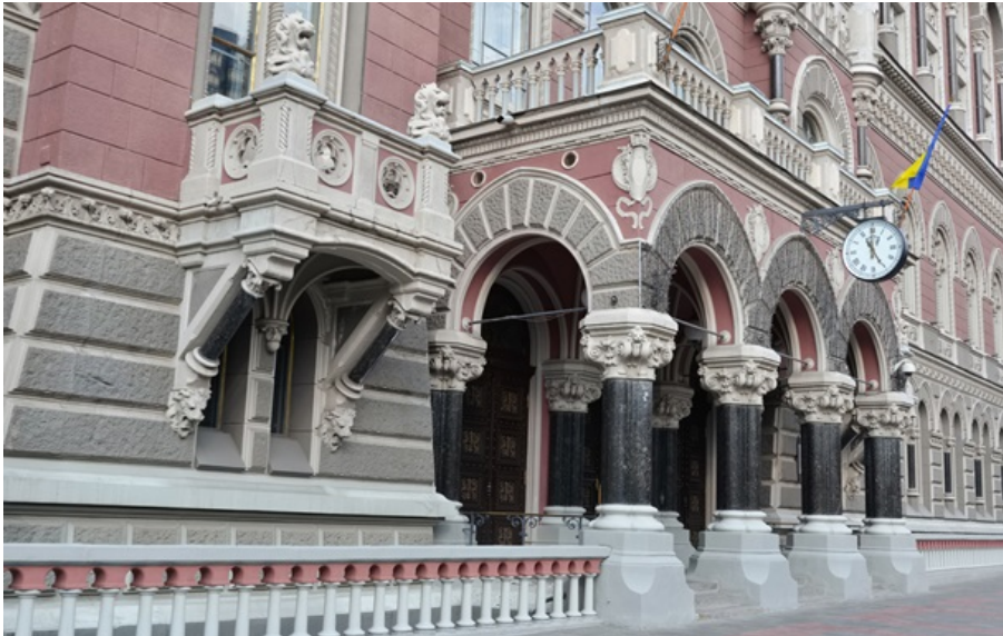
НБУ ліквідував ще один банк

Раніше, у лютому 2026 року, установу визнали неплатоспроможною через невиконання вимог регулятора.