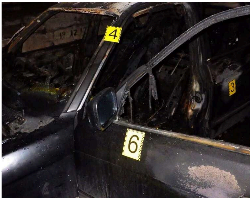
Від крадіжки акумулятора до 10 років тюрми: у Києві двоє чоловіків пограбували та спалили BMW, щоб приховати сліди

13 квітня 2026 року, у понеділок, на вулиці Пластовій у Дніпровському районі Києва двоє чоловіків обікрали припаркований BMW і підпалили його. Подія відбулася нещодавно в столиці. Після спільного застілля зловмисники вирішили "підзаробити", укравши акумулятор та інструменти з автомобіля. Для маскування злочину вони підпалили машину, але поліція швидко викрила та затримала підозрюваних.