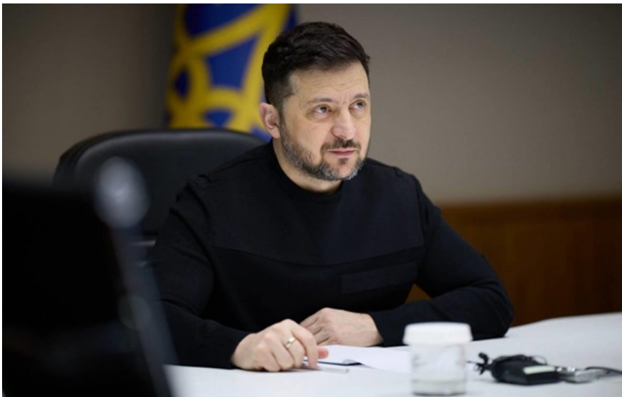
Фото: Пресслужба президента України Володимир Зеленський розповів про результати доповіді Рустема Умерова