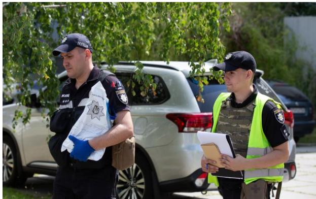
Фото: подія сталася у Голосіївському районі столиці (Getty Images)

У суботу ввечері, 18 квітня, невідомий чоловік відкрив вогонь по людях в одному з районів Києва. Внаслідок інциденту двоє осіб загинули та є поранені.