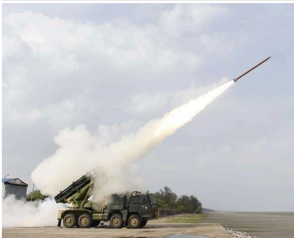
Геть від «іскандерів»: Вірменія веде переговори з Індією про закупівлю балістичних ракет Pralay на заміну російським

Росіяни вже показали себе ненадійним партнером, тому Вірменія не може повністю покладатися на їхні ОТРК «Іскандер». Альтернативою можуть стати індійські балістичні ракети Pralay.