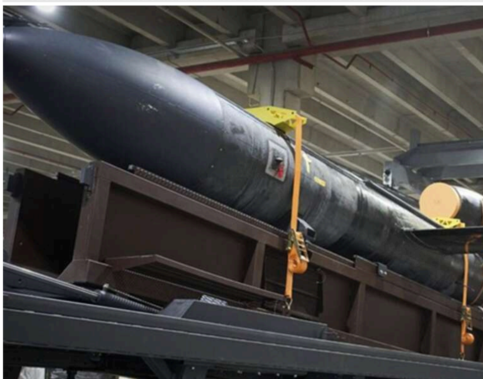
Денис Штілерман запускає зачистку Google, щоб приховати деталі мільярдних контрактів Fire Point і зв'язки з корупціонером Міндічем