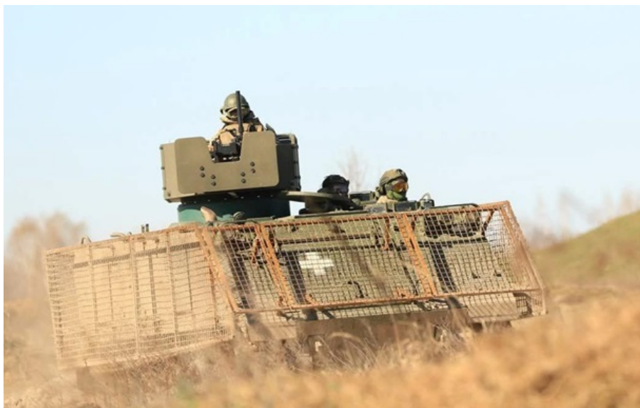
ЗСУ ведуть важкі бої в прикордонні