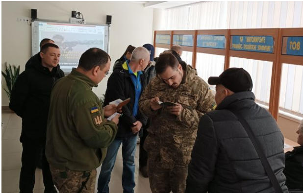
Мобілізація в Україні

Іноді в реєстрах можуть бути неправильні дані про облік військовозобов'язаних, а через це – проблеми у самих чоловіків: на папері людина може бути виключена з обліку, а в базі – порушник. Це дає поліції формальну підставу для затримання й доставки до ТЦК.