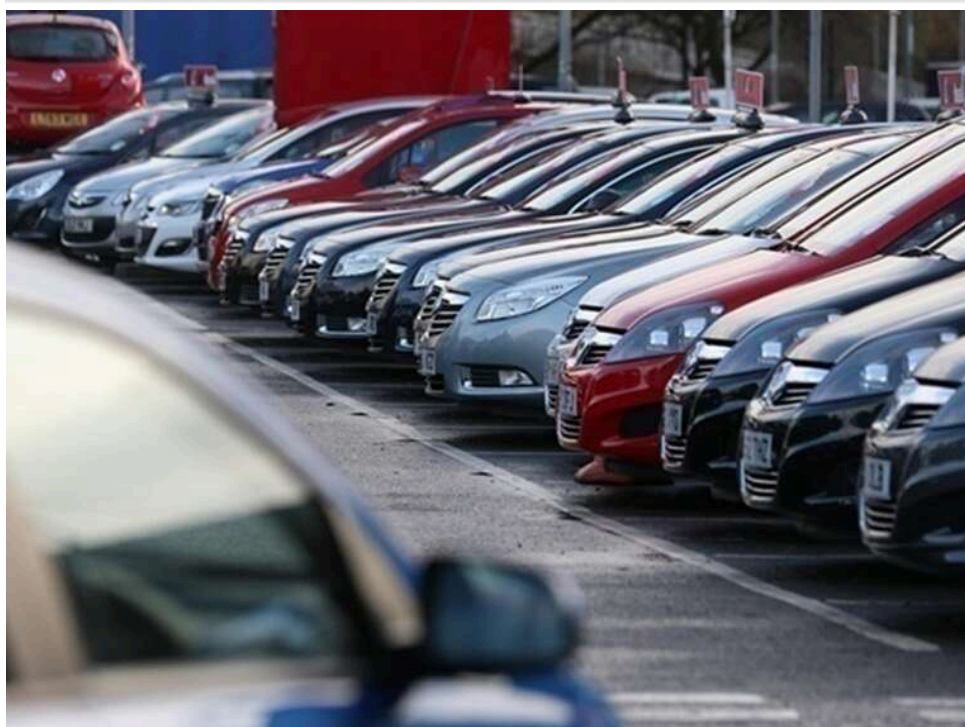
Штраф на 3,2 мільйона: на Волині засудили директора компанії за імпортом 57 авто за підробленими документами