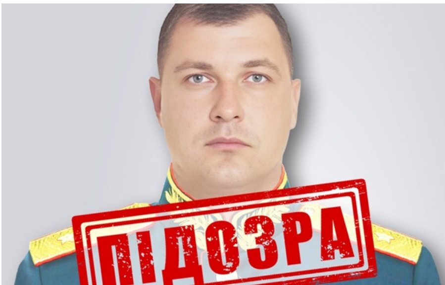
Генералу РФ оголосили підозру за злочини проти цивільних

Російський генерал був причетний до масових катувань цивільного населення Чернігівщини на початку повномасштабної війни.