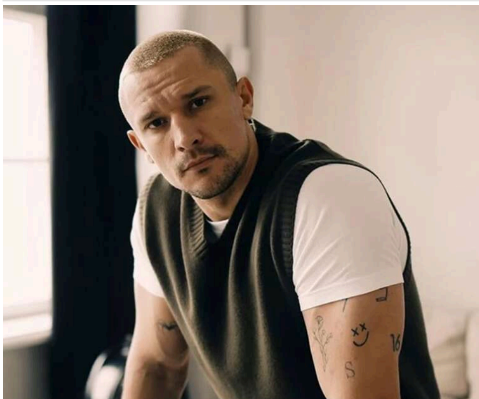
Був на пасажирському сидінні: Тарас Цимбалюк потрапив у ДТП в Києві

Актор Тарас Цимбалюк потрапив у ДТП у Києві.