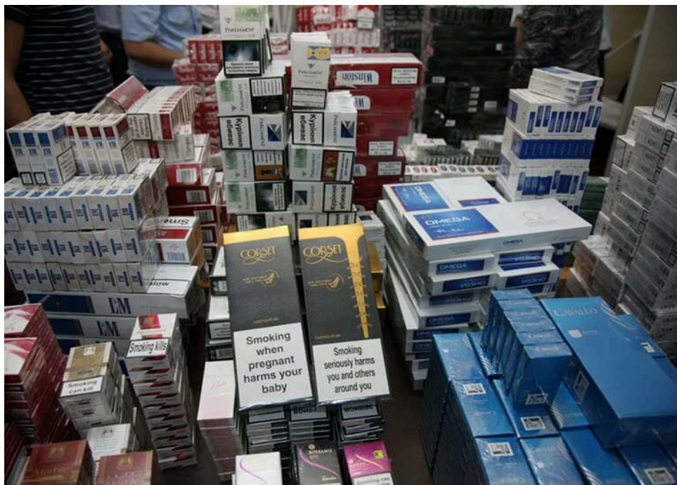
Дорогий «підробіток»: на Закарпатті освітянин за контрабанду цигарок поплатився новим Ford S-max та великим штрафом

На Закарпатті заступник директора дитячого садка втратив автомобіль і сплатить великий штраф за контрабанду сигарет.