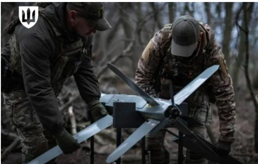
Підрозділи ЗСУ отримують інновації для бойового тестування

Нова модель оборонних закупівель скорочує шлях від розробки до застосування інноваційних рішень у війську.